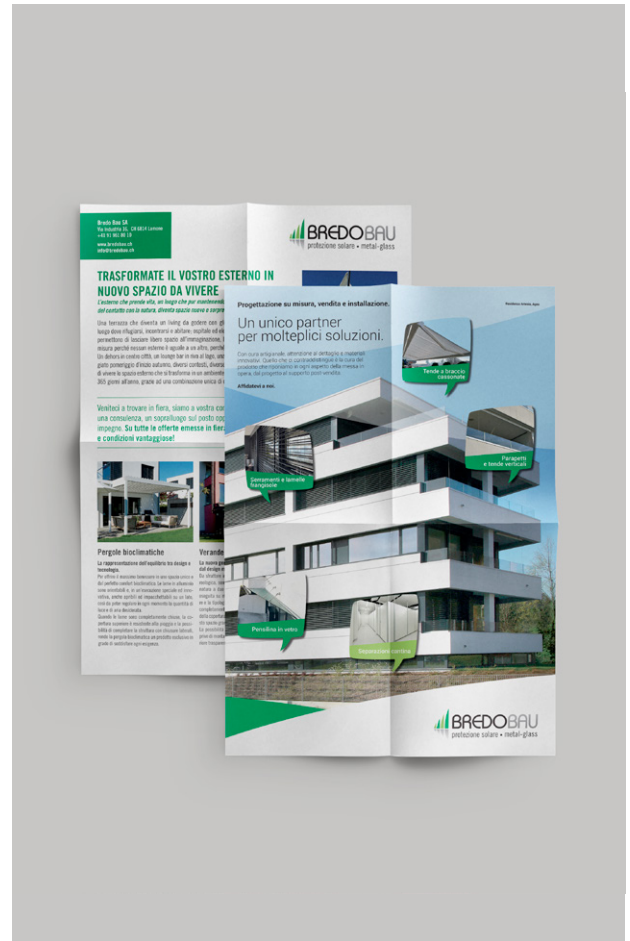
Comunicazione di Prodotto