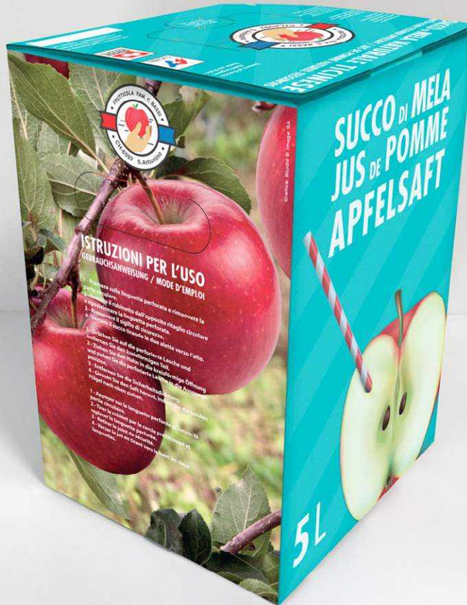
Comunicazione di Prodotto